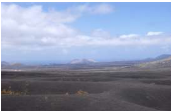
Hoyos de viñas en La Geria.