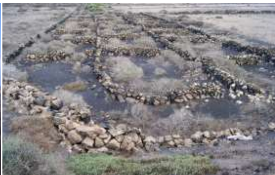
Finca abandonada en Masdache.